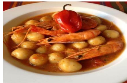
Dombé de crevettes