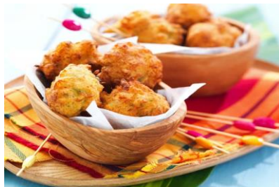
Acras de morue