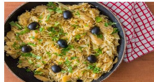
Bacalhao à brás