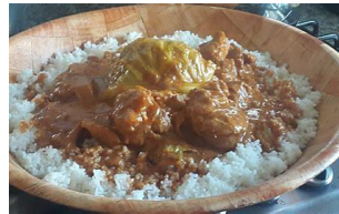
Tiguadégé aussi appelé mafé