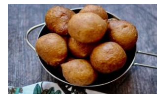
Pof pof (beignets)