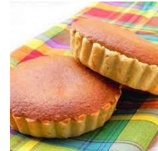
Dessert : le tourment d'amour