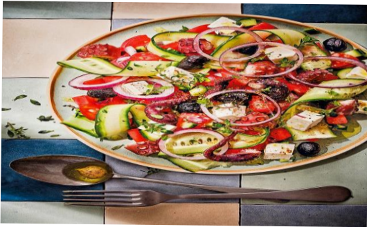
Entrée Salade éthiopienne