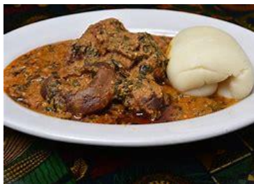
Fufu avec de égusi