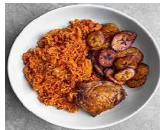
Riz avec du poulet et des banane plantain