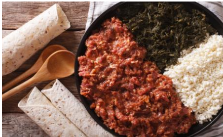
Plat Kettefo ( viandes , fromage blanc, épinards).