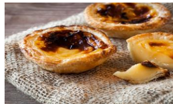
Pastel de natas