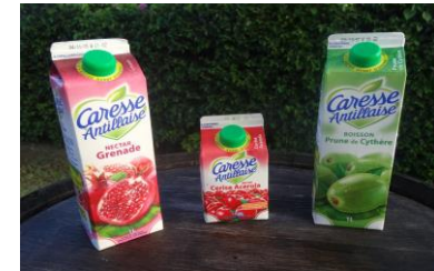
Jus de fruits