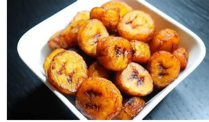
Banane plantain du mali