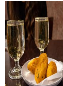
Accras de morue