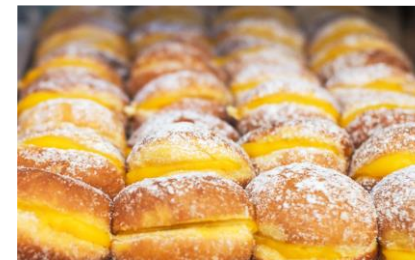
Bola de berlim