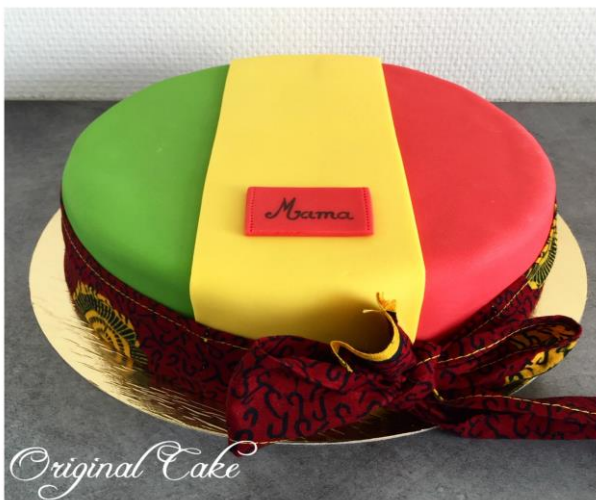
Gateau mali drapeau