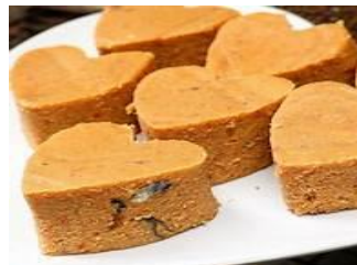
Moi moi (pâte d'oeufs)